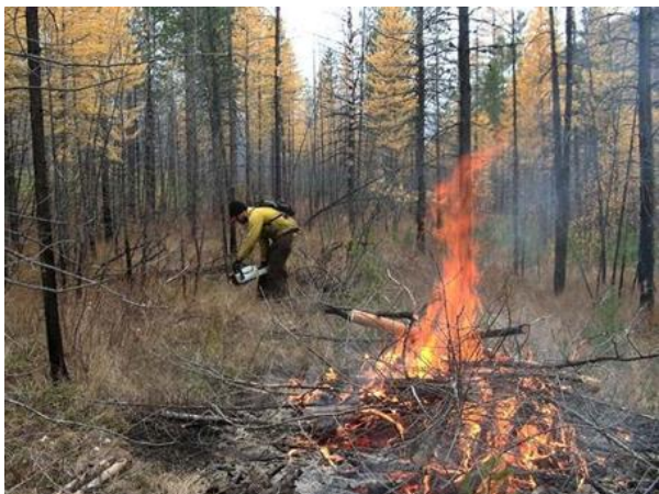
Feu avec peu de fumée, conforme à la loi