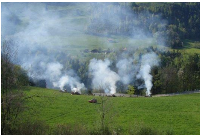
Feux avec trop de fumée, non conforme à la loi

A noter que les infractions aux dispositions légales relatives à l'incinération seront dénoncées au Ministère public sur la base de l'article 61 de la loi fédérale sur la protection de l'environnement (LPE) et l'article 77 de la loi sur les forêts et la protection contre les catastrophes naturelle (LFCN). Toutes les autorités d'exécution ainsi que la police cantonale ont la faculté de procéder aux dénonciations pénales.